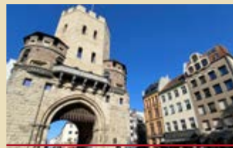
Severinstorburg Chlodwigplatz 19, 50678 Köln Tel. 0221 5606095

Das beliebteste Standesamt außerhalb des Rathauses! Ob Burgsaal, Severin- oder Turmsaal: Die drei Eventräume sind unterschiedlich groß und bieten den perfekten Rahmen für Feiern und Veranstaltungen mit bis zu 120 Personen. Faire, transparente Preise mit All-Inclusive-Paketen ermöglichen, dass Sie von vornherein wissen, was Ihre Feier kosten wird. Beim erfahrenen Severinstorburg-Team ist Ihr Event in besten Händen.