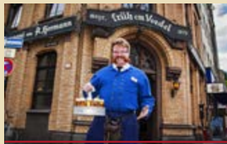
FRÜH „Em Veedel“ Chlodwigplatz 28, 50678 Köln Tel. 0221 314470

An der Severinstorburg befindet sich eine der ältesten Gaststätten Kölns. Sie gilt als Institution in der Veedels-Gastronomie und als „Kneipe im kölschen Milljö“. Hier treffen sich Menschen aller Gesellschaftsschichten und Altersgruppen auf ein Verzällcher beim frisch gezapften Kölsch. Bei den Speisen gilt: kräftig, deftig, typisch kölsch! Im angeschlossenen Shop bekommen Sie stets frisches, gekühltes Früh Kölsch für zu Hause.