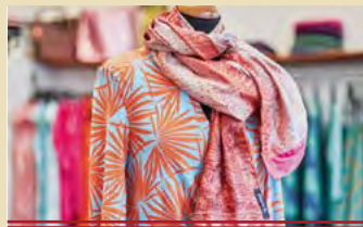
PLAN B. Modedesign Kurfürstenstraße 4, 50678 Köln Tel. 0221 9311031