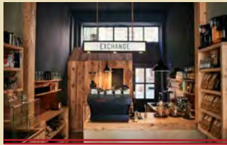
einbrand Café der Rösterei Bonner Straße 38, 50677 Köln Tel. 0221 78940347