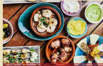
TapaVinho im Fertig Bonner Str. 26 / Kurfürstenstraße 29 50677 Köln Tel. 0221 311199

Eine kulinarische Reise durch Portugal und Spanien mit frischen warmen und kalten Tapas. Großen Wert legt man auf eine authentische Zubereitung der Speisen. Die Basis dafür sind natives Olivenöl und Meersalz aus Portugal. Bei schönem Wetter locken die Plätze im Freien! Jetzt fehlt nur noch das Rauschen des Meeres ... In diesem Sinne wünschen wir einen tollen Abend und Buen Provecho!