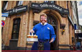
FRÜH „Em Veedel“ Chlodwigplatz 28, 50678 Köln Tel. 0221 314470

An der Severinstorburg befindet sich eine der ältesten Gaststätten Kölns. Sie gilt als Institution in der Veedels-Gastronomie und als „Kneipe im kölschen Milljö“. Hier treffen sich Menschen aller Gesellschaftsschichten und Altersgruppen auf ein Verzällcher beim frisch gezapften Kölsch. Bei den Speisen gilt: kräftig, deftig, typisch kölsch! Im angeschlossenen Shop bekommen Sie stets frisches, gekühltes FRÜH Kölsch für zu Hause.