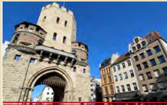
Severinstorburg Chlodwigplatz 2, 50678 Köln Tel. 0221 5606095

Das beliebteste Standesamt außerhalb des Rathauses! Ob Burgsaal, Severin- oder Turmsaal: Die drei Eventräume sind unterschiedlich groß und bieten den perfekten Rahmen für Feiern und Veranstaltungen mit bis zu 120 Personen. Faire, transparente Preise mit All-Inclusive-Paketen ermöglichen, dass Sie von vornherein wissen, was Ihre Feier kosten wird. Beim erfahrenen Severinstorburg-Team ist Ihr Event in besten Händen.