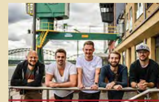
Digital Buddies Bonner Straße 14, 50677 Köln Tel. 0160 8964033

Die Digital Buddies möchten gemeinsam mit Dir neue digitale Geschäftsmodelle und Prozesse entwickeln; dabei auf Augenhöhe mit Dir und für Deine Kunden zusammenarbeiten. Denn sie verstehen sich als Partner (Buddy), der Dir die Möglichkeiten der digitalen Transformation aufzeigt und Dich und Dein gesamtes Team dazu befähigt, die wertvollen Chancen und Ressourcen der Digitalisierung aktiv zu nutzen.