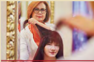
Penny Lane Kurfürstenstraße 23a, 50678 Köln Tel. 0221 3101310