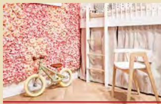
Bartels Kinderwelt Bonner Straße 15-17, 50677 Köln Tel. 0221 48535497

Kinder haben Geschmack, und der ist keineswegs so kindisch wie viele denken. Die Kinderwelten von Bartel regen ihn an: mit einem leidenschaftlich komponierten, auf Schritt und Tritt überraschenden Sortiment an Möbeln, Textilien, Accessoires und Spielzeug. Von piffig bis lässig, von aufregend bis verträumt. Präzise Beratung und exzellenter Service inklusive. Hier wird das Geheimnis wirklich guter Kinderware enthüllt.