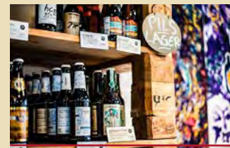
Bierlager Bonner Straße 38, 50677 Köln Tel. 0221 64000599

Aus purer Begeisterung für Craft Bier wurde 2015 ein Ladenlokal mit gemütlichen Sitzecken und wechselnden Bieren vom Fass. Hervorragende Produktkenntnisse und sehr gute Branchenvernetzung ermöglichen ein einzigartiges, vielschichtiges und innovatives Sortiment, das sowohl die bereits in der Craft Bier Szene bekannteren Marken beinhaltet, als auch besondere Spezialitäten.