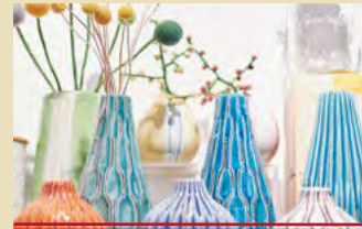
Die Tagediebe Hirschgäßchen 1, 50678 Köln Tel. 0221 16810504

Dieser „Kaufladen“ macht Dein Leben bunter: Mit dem sorgfältig zusammengestellten Programm an illustrierten Kinderbüchern, Belletristik und besonders gelungenen Titeln zum Thema Kochen, DiY und Lifestyle. Mit ausgewählten Vasen und Geschirr, mit originellem Deko-Schnickses, siebgedruckten Geschirrtüchern, Papeterie, Designprodukten zum Benutzen und Schönfinden. Es gilt: „Nie wieder langweilig schenken!“