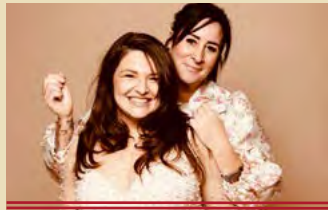
J&K BEAUTY:ful YOU Bonner Str. 33, 50677 Köln Tel. 0152 24374151